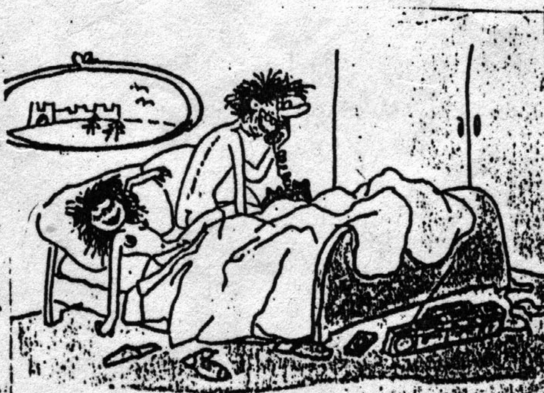
— Але! Лондан? Рэдакцыя Кнігі рэкор- даў Гінеса?

Першае мейсца заняло такое тлумачэнне: "Мадам, я павінен выйсці дапамагчы свайму сябру з якім пазнаёмлю вас крыху пазней."