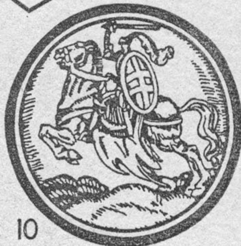
ТАВАРЫСТВА БАЦЬКАУШЧЫНА (1918)