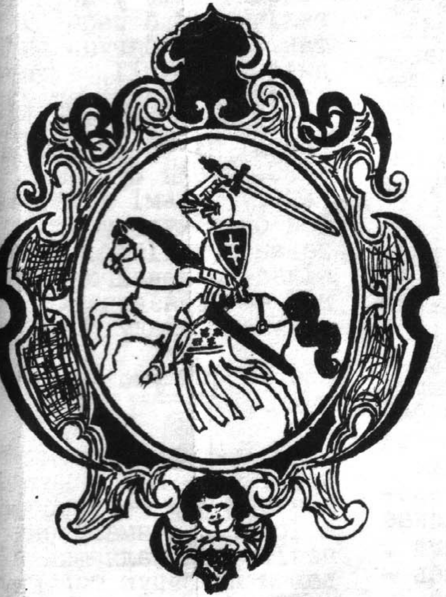
Адна з выяў гербу "Пагоня"

Ад рэдакцыйнай групы: пры напісаньні былі выкарыстаныя некаторыя матэрыялы /у прыватнасьці, малюнкi/ з кнігі А. Цітова "Гарадзкая геральдыка Беларусі"