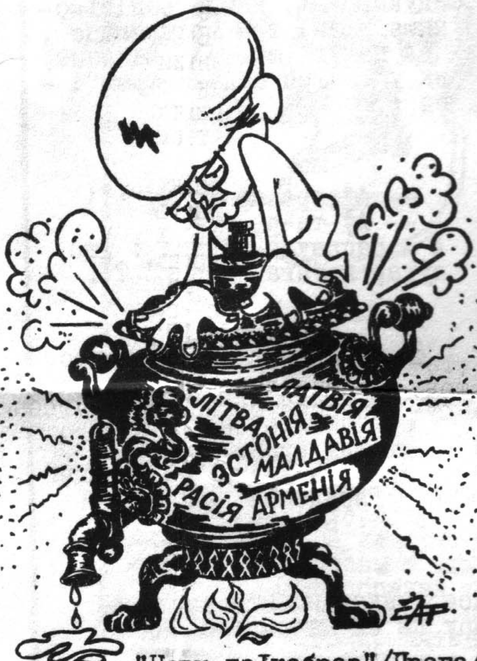
"Новы дзікабраз" /Прага/ № 16, 1990 г.

/ ІМА-прэс — па матэр'ялах часопісу "НьюсуІк" /