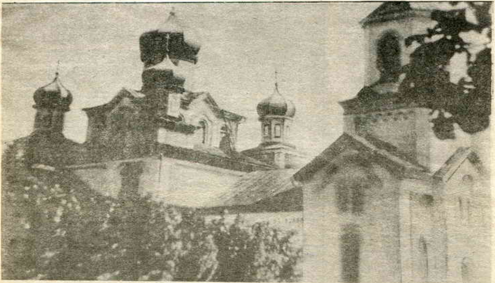
Бабруйскі Мікалаеўскі сабор зруйнаваны ў 1961 годзе.

Янка Купала «Справа незалежнасьці Беларусі за мінулы год» «Беларусь» №8 (64) 14 студзеня 1920г.