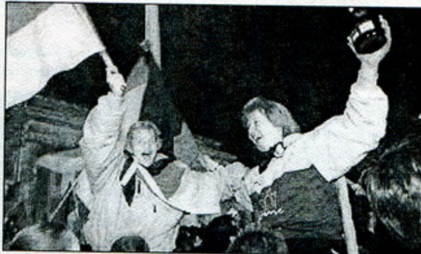
Апоўначы ў Германіі пачалося свята

У былой ГДР прайшло паляваньне на ведзьмаў. Хтосьці з былых лідараў апынуўся ў выгнаньні, хтосьці на лаўцы падсудных, а потым за кратамі. Зна-