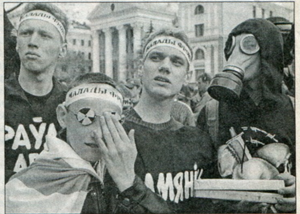
Падчас акцыі «Чарнобыльскі шлях – 2001» у Менску

Каля 300 чалавек сабралася ў Маладэчне 25 красавіка ў Гарадзкім парку,