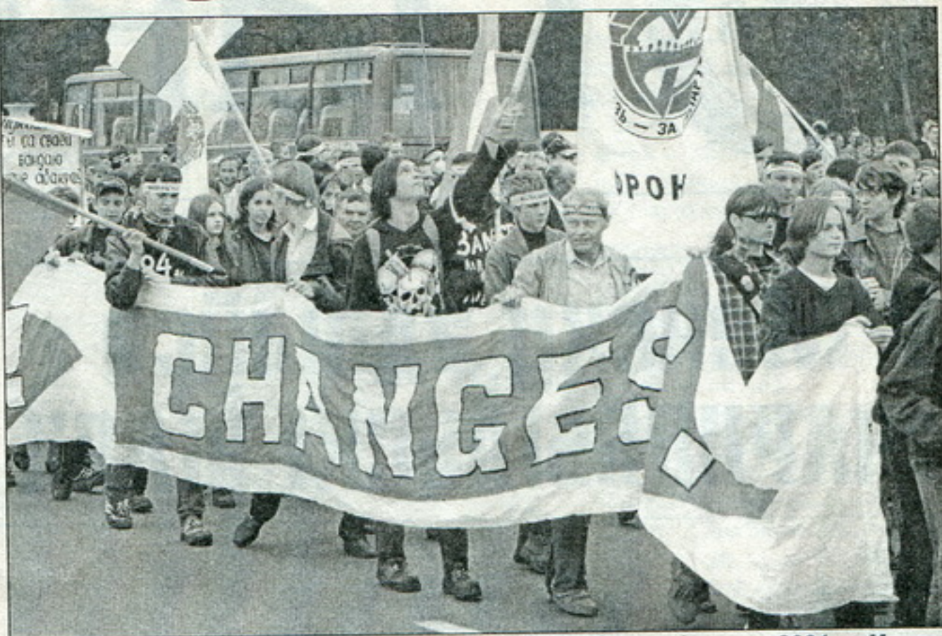
Падчас акцыі «Чарнобыльскі шлях – 2001» у Менску

Вінцук Вячорка, старшыня БНФ, так пракамэнтаваў вынікі акцыі: "Гэта найперш чарнобыльская акцыя. Ейная задача, як і самага першага "Чарнобыльскага шляху", – прыцягнуць увагу сьвету да трагедыі, што адбылася 15 год таму, а таксама паказаць, што гэтая трагедыя не хвалюе цяперашнюю ўладу. Праўда, мяркуючы па прапагандовай гістэрыі, што разгарнулі ўрадавыя СМІ напярэдадні акцыі, пад нашым ціскам улады зрабілі выгляд увагі на Чарнобыльскія праблемы. Аднак усім вядома, што з прыходам да ўлады Лукашэнкі былі адмененыя ранейшыя гуманныя дасягненні дэмакратычных сілаў у гэтай сфэры: спыненае перасяленьне людзей з забруджаных радыяцыяй тэрыторыяў, адмененая забарона вырабу сельскагаспадарчай прадукцыі ў чарнобыльскай зоне. Лукашэнка, ці то з-за жаданьня плянамерна знішчаць беларускую нацыю, ці то з-за катастрофічнага развалу эканомікі, скасаваў ранейшыя рашэньні