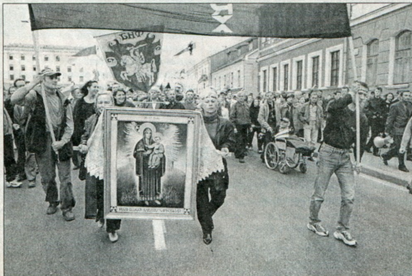
Падчас акцыі «Чарнобыльскі шлях – 2001» у Менску

25 красавіка ў Горадні зь 17 да 18 гадзінаў прайшоў малебен у Каложы па ахвярах Чарнобыльскай катастрофы. Пасьля служэньня ўсе людзі рушылі па шляху краёўцаў, якія, нагадаем, 2 гады назад у гэты дзень былі зьбітыя. На тым месцы былі ўскладзеныя кветкі. Увесь шлях удзельнікаў суправаджалі міліцыянты, але ніхто затрыманы ня быў.