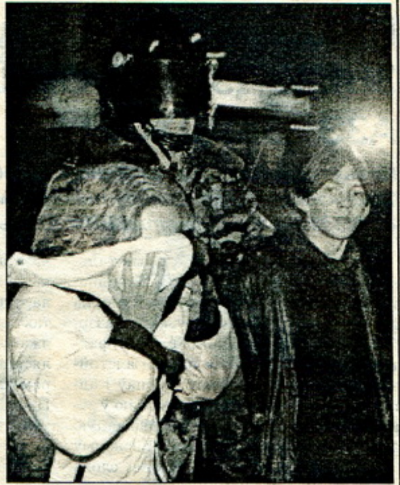
Хапалі ўсіх: маладых людзей, непаўнагадовых і дзяўчат.

маладых людзей, непаўнагадовых і дзяўчат дзясяткамі запіхвалі ў міліцэйскія грузавікі, аўтобусы й машыны. Затрымлівалі таксама і выпадковых сьведкаў акцыі. У гэты ж час моладзь, якая вырашыла адысьці назад, з вуліцы Дарашэвіча была адсечаная міліцыяй. У дварах за крамай «Белвэст», куды хлынула частка моладзі, адбыліся жорсткія сутычкі. Некалькі мала-