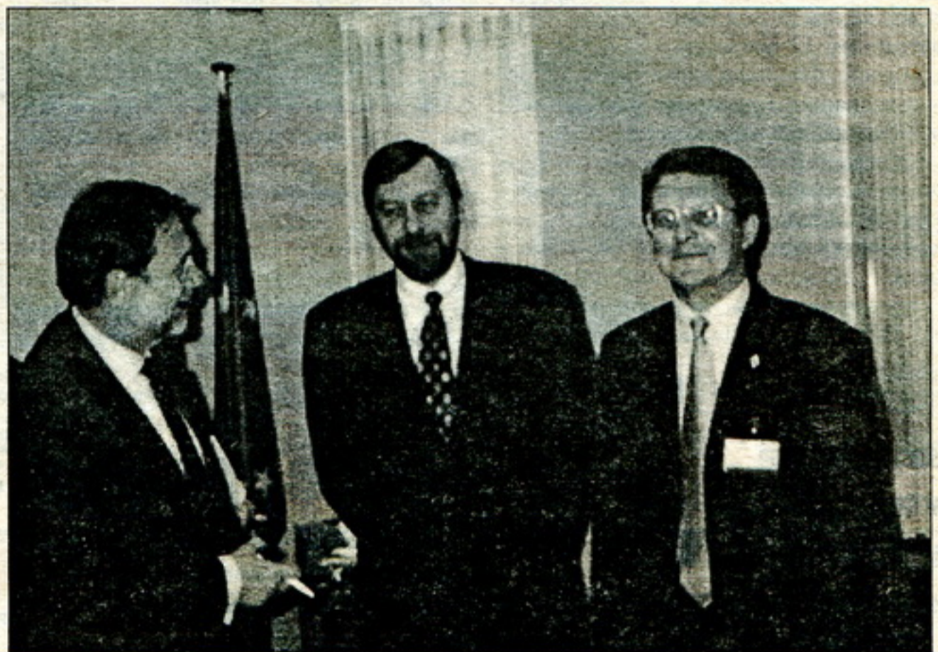
Падчас сустрэчы з Хаўерам Саліям.

Турнэ распачалося 13 лістапада сустрэчай у Парыжы. Прадстаўнікоў беларускага дэмакратычнага руху прымала кіраўніцтва дэпартаменту Ўсходняй Эўропы французскага МЗС. У гэты ж дзень адбылася сустрэча ў Брусэлі з камісарам Эўрапейскага Зьвязу па міжнароднай палітыцы Крысам Паттэнам.