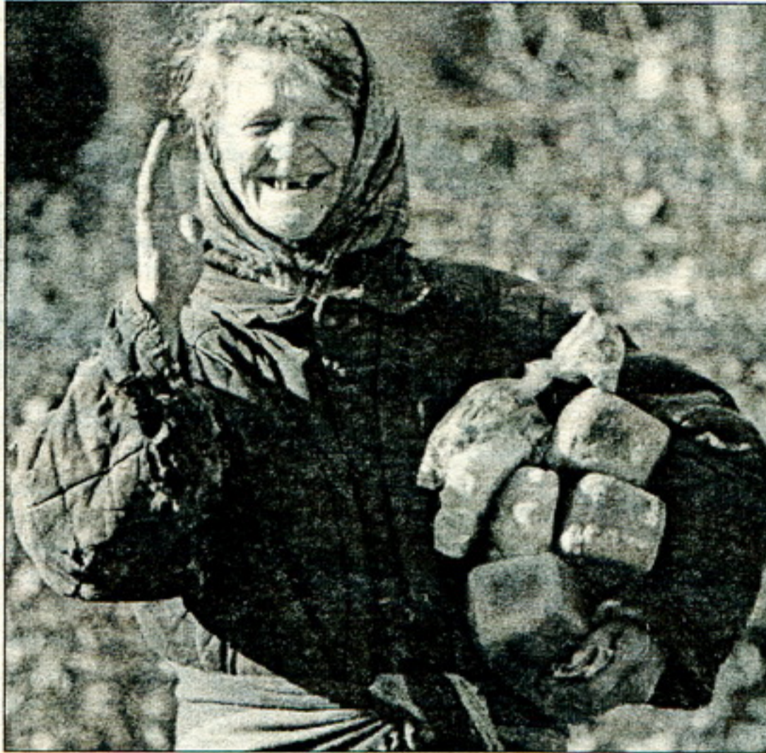
Некаторыя беларусы галасуюць за ўчорашні дзень.

нар» у дачыненні да Лукашэнка. Аднак умовы ў Менску і Бялградзе вельмі і вельмі розныя. Па-першае, людзі больш абыхавыя, па-другое, пачуцьцё нацыянальнае самасьведомасьці менш разьвітае, а апазыцыя слабейшая. Усё большая колькасць людзей спаўзае за мяжу беднасьці, але пакуль Расея будзе пастаўляць танныя энэргарэсурсы, эканоміка так-сяк будзе трымацца.