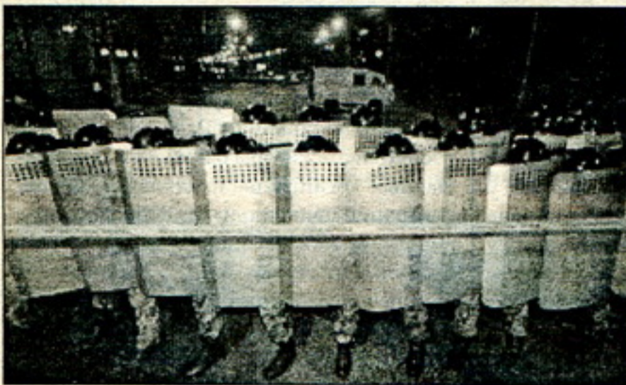
Каля ЦУМу праспект перакрылі некалькі шэрагаў амонаўцаў у поўнай экіпіроўцы.

Маладзёвая Кааліцыя «Пераменаў!» заяўляе, што ні запалохваньні, ні рэпрэсіі ня змогуць спыніць беларускую моладзь, якую дастала жыцьцё без свабоды й без пэрспектывы, у краіне, дзе пануе аўтарытарны рэжым. Дыктатура й той, хто гэтую дыктатуру ўсталёўвае, сьйдуць у нябыт, а гісторыю новай, прыгожай Беларусі будзе пісаць моладзь, якая сёньня патрабуе ПЕРАМЕНАЎ!