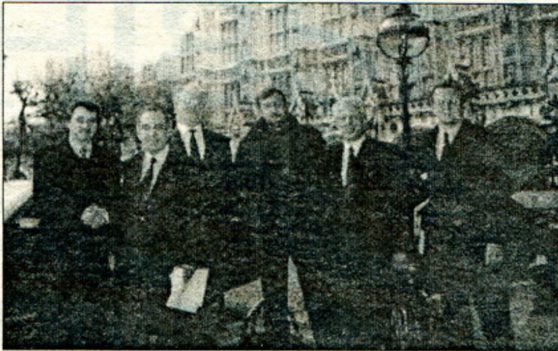
Падчас сустрэчы лідэраў беларускай апазыцыі з ангельскімі парламэнтарамі.

У сераду 15 лістапада Беларуская дэлегацыя прыбыла з Брусэлю ў Страсбург. У Эўрапейскім парламэнце яны мелі спатканьне з кіраўніцтвам спецыяльнае дэлегацыі Эўрапарляменту ў справах Беларусі (Ян Марынус Віерма, Нідэрляндцы; Леанарт Сакрэдэўс,