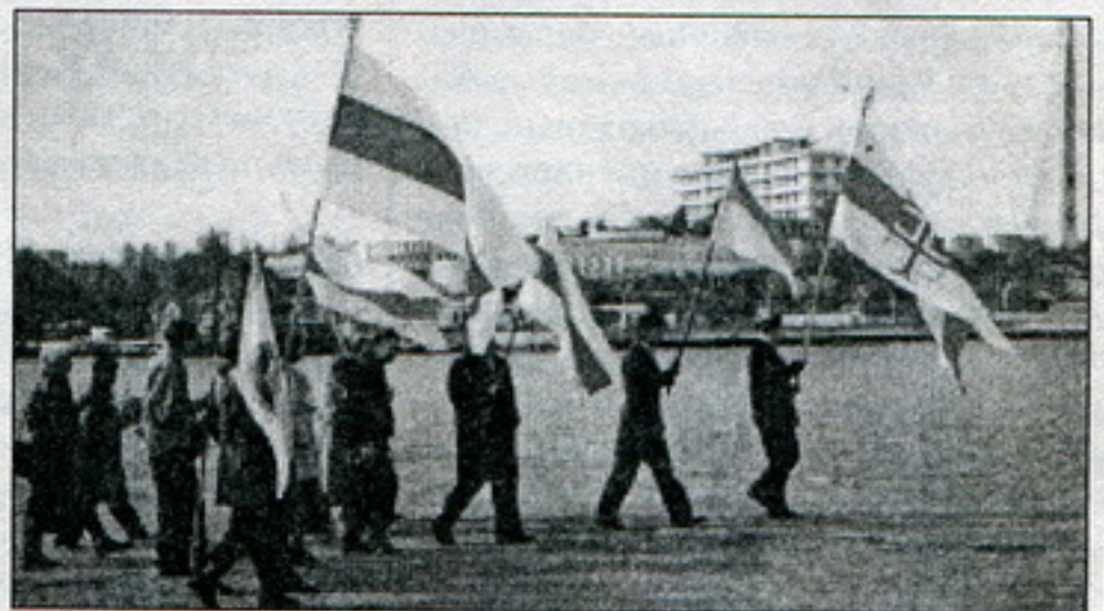
Марш па наберажнай.

Віцебскі, Магілёўскі, Менскі, Віленскі, Літоўскі, якія ўдзельнічалі ў Крымскай вайне 1854 – 1855 гг.) да помніку мараку-герою Аляксандру Казарскаму, ураджэнцу г. Дуброўна Віцебскай вобласьці. Украінскія беларусы ўсклалі кветкі так-