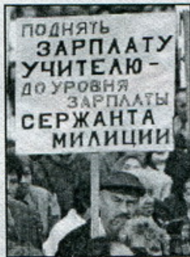
Мітынг у 1999 г.

Днямі была пададзена заяўка ў гарвыканкам. Працоўныя збіраюцца пратэставаць супраць зьніжэньня жыцьцёвага