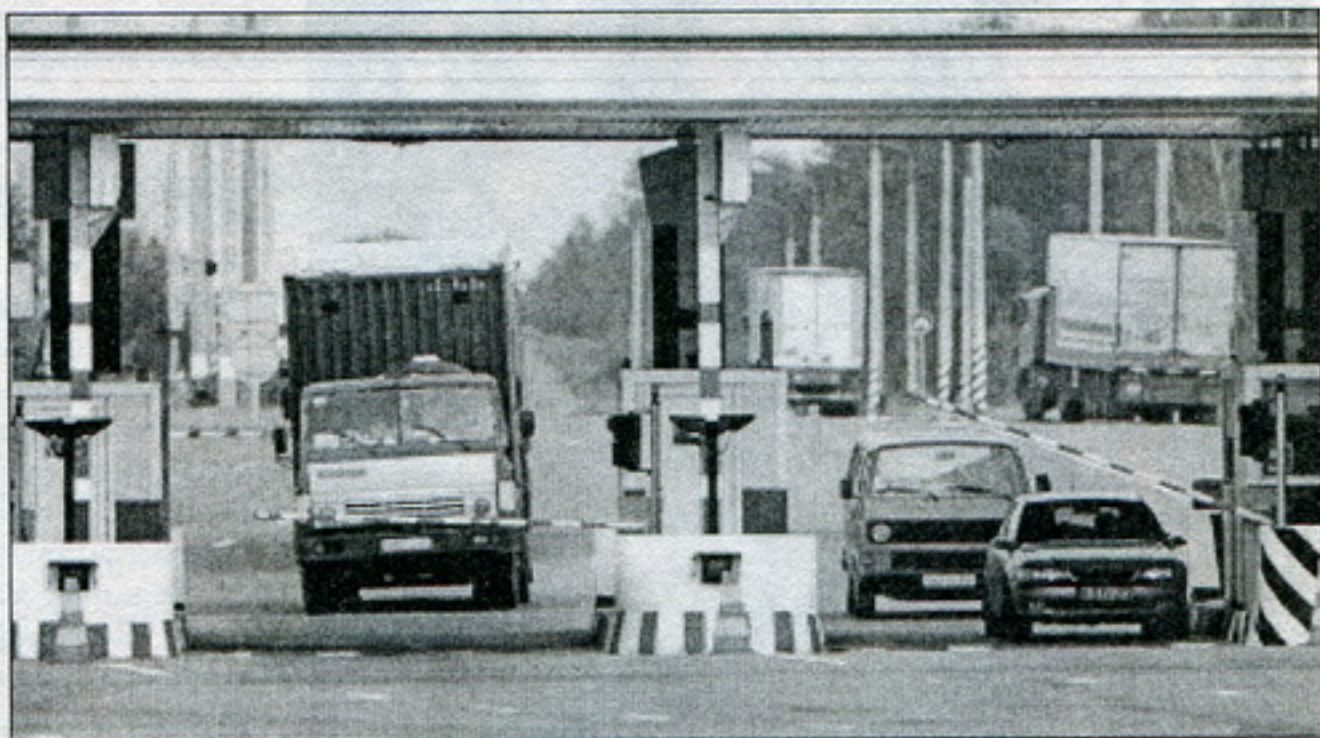
Пераезд на беларуска-расейскай мяжы.

Інтэграцыя патрабуе, паводле Пуціна, пазбаўленьня часткі суверэнітэту, а таму спачатку неабходна сто раз памераць перад тым, як адрэзаць. Беларускі дыктатар, прызвычаены спачатку адразаць, быў разгублены».