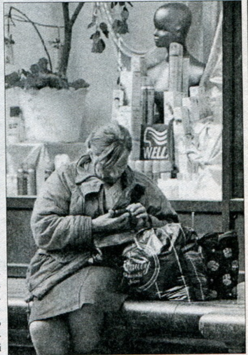
Жанчына лічыць грошы каля ГУМу. Менск.

Паводле словаў Віка, парлямэнцкая асамблея АБСЭ дагэтуль разглядае пытаньне сваіх адносінаў з прызначаным 4 гады таму парлямэнтам. Асамблея мае падрыхтаваць даклад па гэтай праблеме пазьней. У той жа час Эўрапарлямэнт ставіць свае ўмовы на шляху да нармалі-