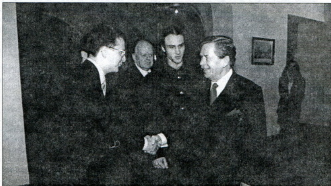
Падчас сустрэчы з чэскім прэзідэнтам

У ліку найбольш істотных сустрэчаў трэба назваць спатканьні з сэнатарамі Міхалам Жантоўскім – старшынём міжнароднай камісіі Сэнату, і сэнатарам Янам Румулам – кіраўніком Аб'яднанага дэмакратычнага альянсу. Яны бывалі ў Беларусі, дарэчы, у дзень Чарнобыльскага Шляху, і выдатна разьбіраюцца ў нашай сытуацыі. Сэнатары пацьвердзілі рашучую пазыцыю па ўсіх пытаннях якія мы ўздымалі: непрызнаньне лукашэнкаўскага рэжыму, ціск на Маскву з мэтай недапушчэньня інкарпарацыі Беларусі ў Расею, змаганьне за дэмакратычныя ўмовы прэзідэнцкіх выбараў. Гэтыя сэнатары прадстаўляюць правацэнтрысцкія сілы, але мы сустракаліся таксама зь людзьмі кіроўнага блёку партыі ОДС і сацыял-дэмакратаў, сярод іх спадар Заоралек – кіраўнік Міжнароднай камісіі ніжняй палаты чэскага парламэнту. Сустракаліся мы з намесьнікам міністра замежных спраў Марцінам Палоўшам, з