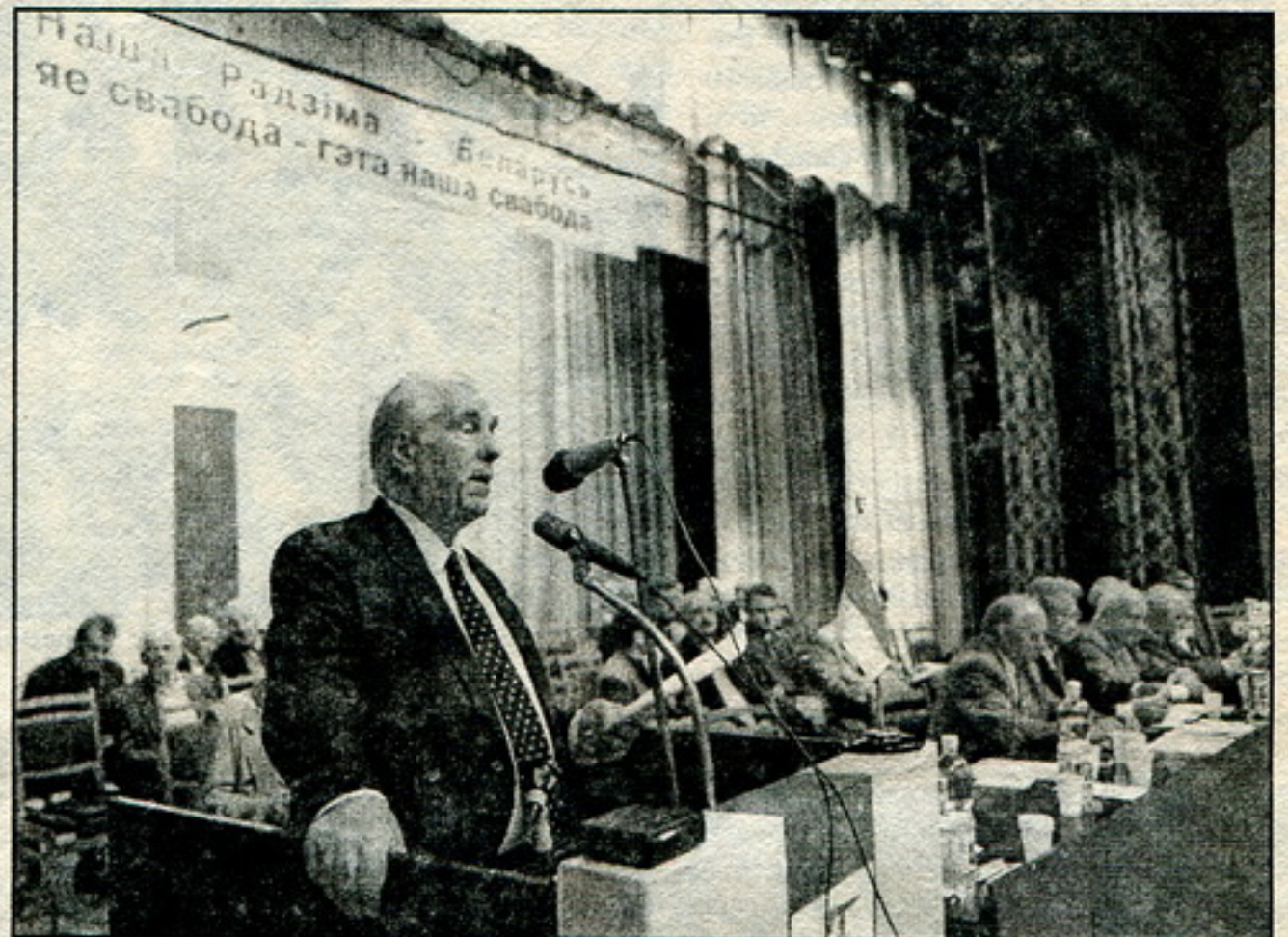
Народны паэт Беларусі Ніл Гілевіч выступае на Усебеларускім зьездзе за незалежнасьць