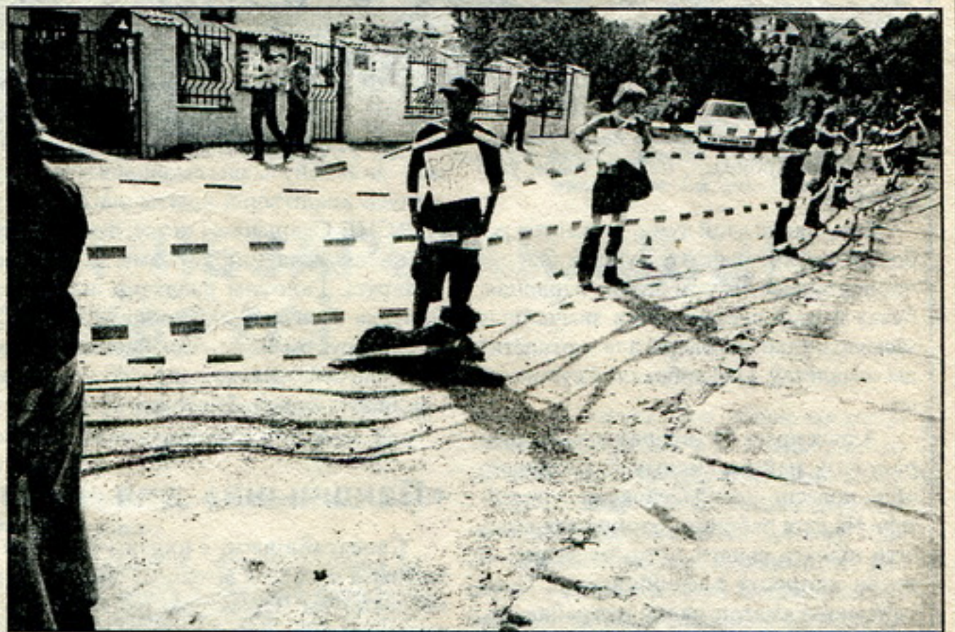
27 ліпеня. Пікет у Празе.