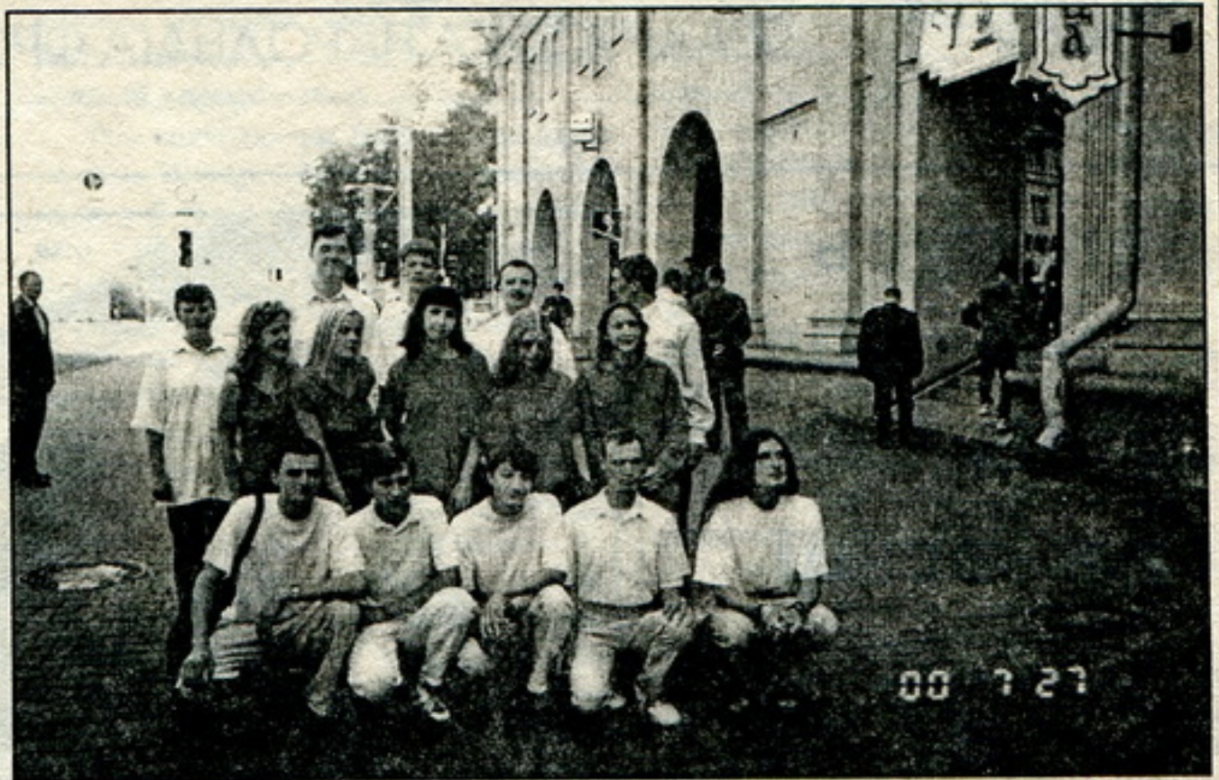
Лятучы пікет на праспэктэ Ф. Скарыны

Тады людзі, узяўшы ў рукі бел-чырвона-белыя сьцяжкі ды віншавальныя ўлёткі, прайшлася вуліцамі гораду. Без перашкодаў сьвяточная калёна колькасьцю блізу 70 чалавек пракрочыла цэнтральнымі вуліцамі й спынілася ля гістарычнага цэнтру горада - Пелагееўскага гарадзішча, дзе быў зладжаны невялікі мітынг. Нягледзячы на значную колькасьць міліцыі і амону, эксцэсаў не адбылося. Пасьля мітынгу магілёўцы разьфліся па хатах, каб у сямейным коле працягнуць сьвяткаваньне Дня Незалежнасьці.