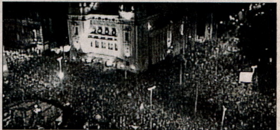
27 верасьня на галоўным пляцы Белграду 200000 прыхільнікаў Каштуніцы сьвяткавалі перамогу на выбарах

На што ж спадзяецца апазыцыя? Доступу да дзяржаўных мэдыяў яна ня мае, штаб Каштуніцы абраў тактыку перадвыбарчай кампаніі "ад дзьвераў да дзьвераў": агітатары ходзяць па кватэрах і пераконваюць людзей.