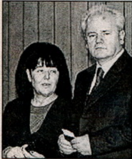
Прыхільнікі Мілошавіча сьцьвярджалі спачатку, што наперадзе ён

Але, магчыма, галоўнае, на што звяртаюць увагу ўсе наглядальнікі - гэта вельмі крытычнае стаўленьне кандыдата дэмакратычнай апазыцыі да Захаду, у прыватнасці, да Амэрыкі. Ён кажа, што падыходы як Амэрыкі, гэтак і Мілошавіча - гэта "пятля на шыі Сэрбіі".