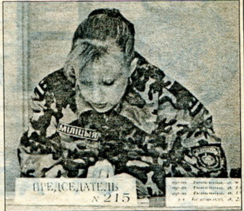
Галасаваньне на парлямэнцкіх выбарах. На месцы старшыні ўчастковай камісіі сядзіць дзяўчына – афіцэр міліцыі.

Зноў жа, афіцыйная інфармацыя не супадае са звесткамі незалежных назіральнікаў. Як сьцьвярджаюць назіральнікі, выбары не адбыліся ў акругах № 33 і 35. Датэрмінова ў Гомлі прагаласавала 13%. У Гомельскім раёне – 17%. У Буда-Кашалёве, паводле звестак камісіяў, датэрмінова прагаласавала ажно 23% выбарнікаў.