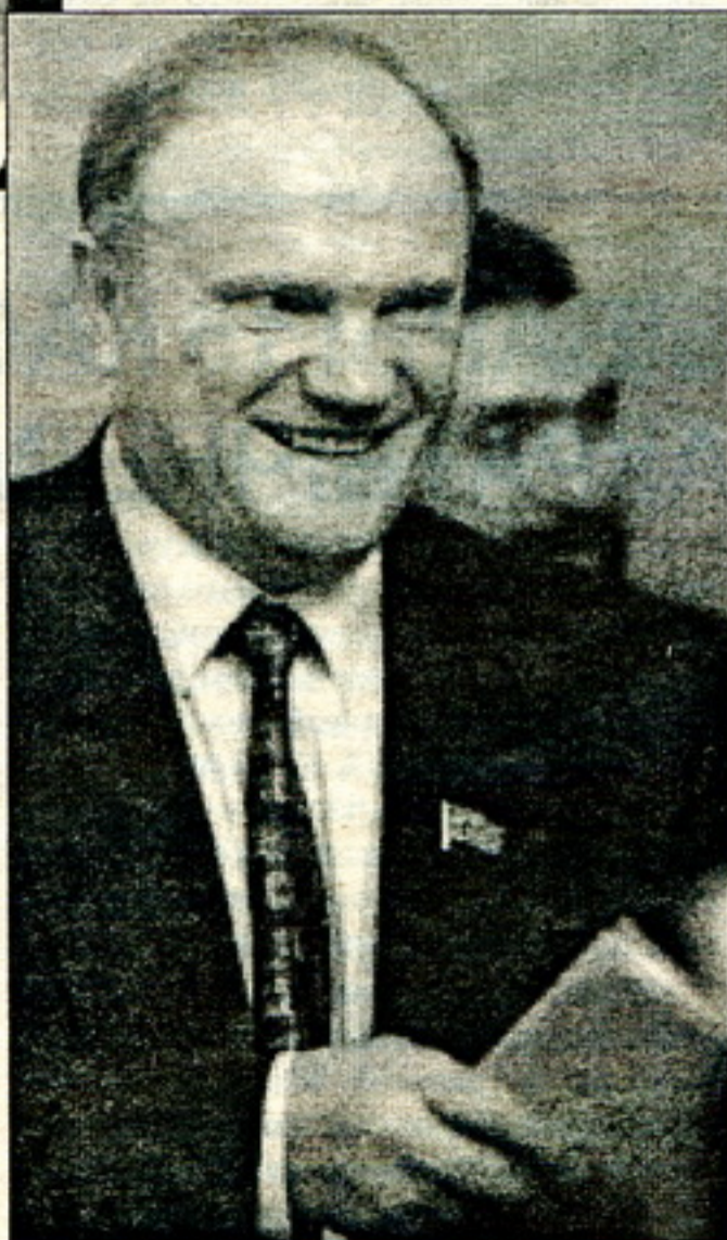
...Але павіншавалі яго зь перамогай толькі з Расеі