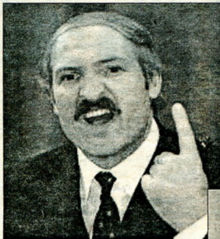
Лукашэнка даказваў, што ў яго ўсё атрымалася...

Таму няма нічога дзіўнага ў тым, што Пуцін заповольвае курс на аб'яднаньне з Беларуссю.