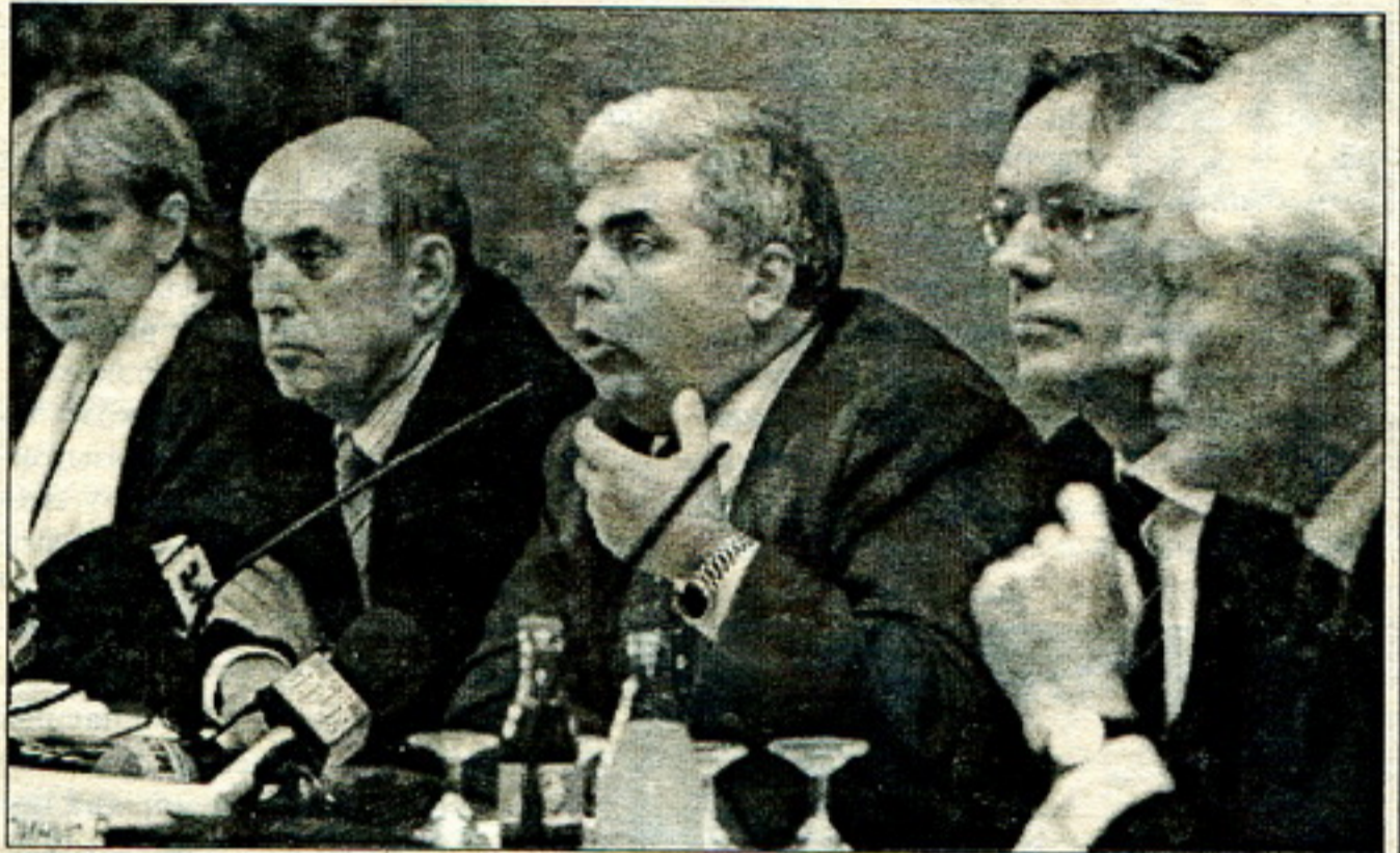
Прадстаўнікі Парлямэнцкай тройкі АБСЭ правялі раніцай 16 кастрычніка прэс-канферэнцыю наконт палітычнай сытуацыі ў Беларусі пасля праведзеных выбараў

1. Ажыццяўленне выканаўчай уладай кантролю за работай выбарчых камісіяў.