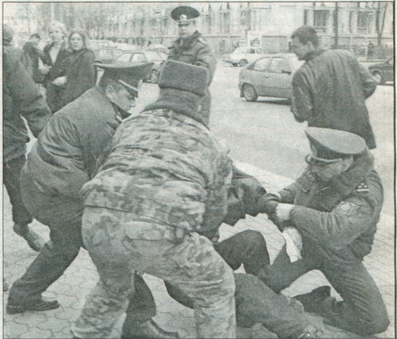
Так сьвяткавалі Дзень Канстытуцыі 15 сакавіка 2001 г.

Зь сёньняшняй пазыцыі можна сказаць, што можна было падысьці да гэта-