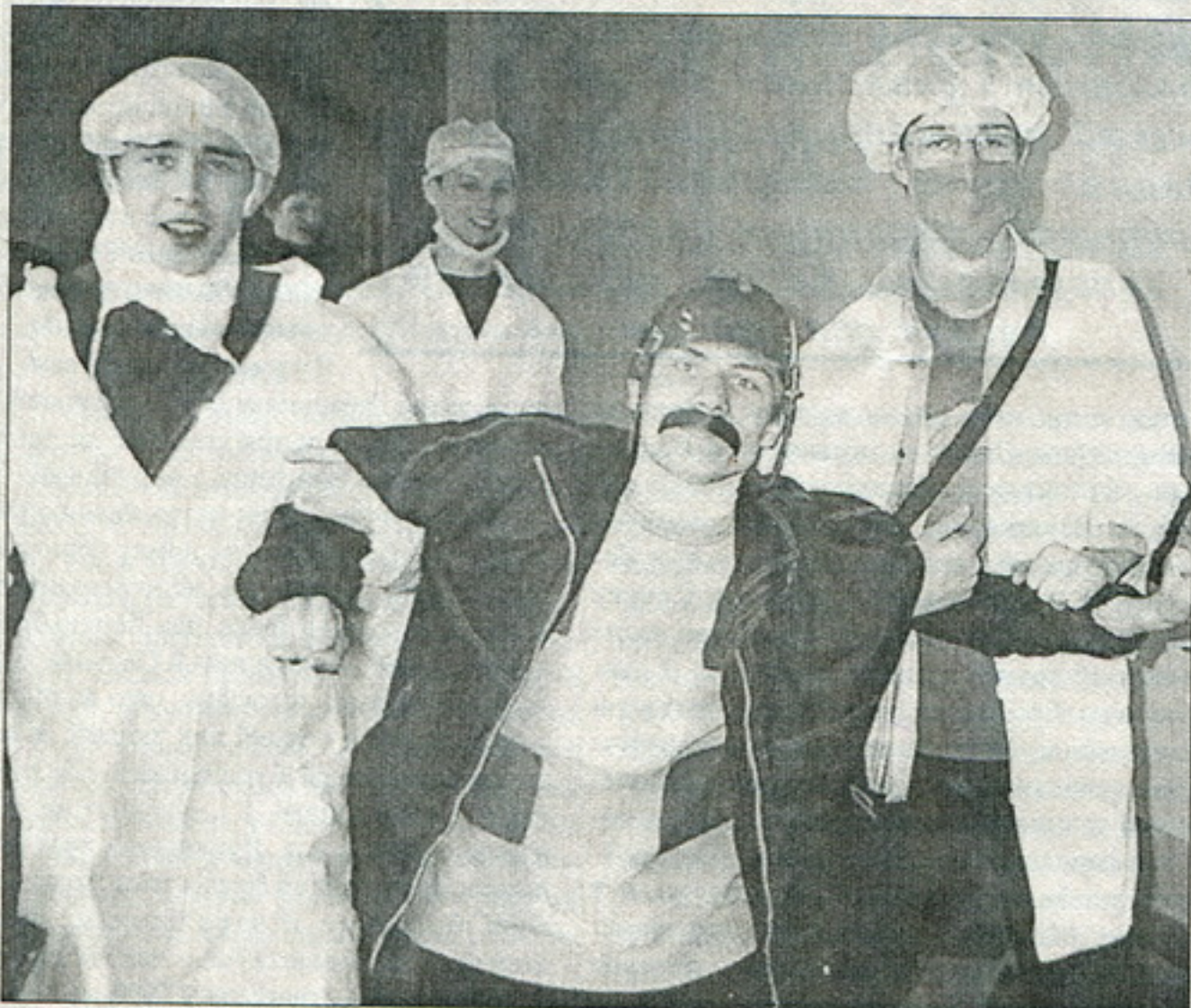
Мазаічная псыхапатыя – гэта небяспечна!

Але ж галоўны рэцэпт: прыйсьці на прэзыдэнцкія выбары й прагаласаваць за здаровага кандыдата. Усімі сродкамі супраціўляцца фальсыфікацыі.