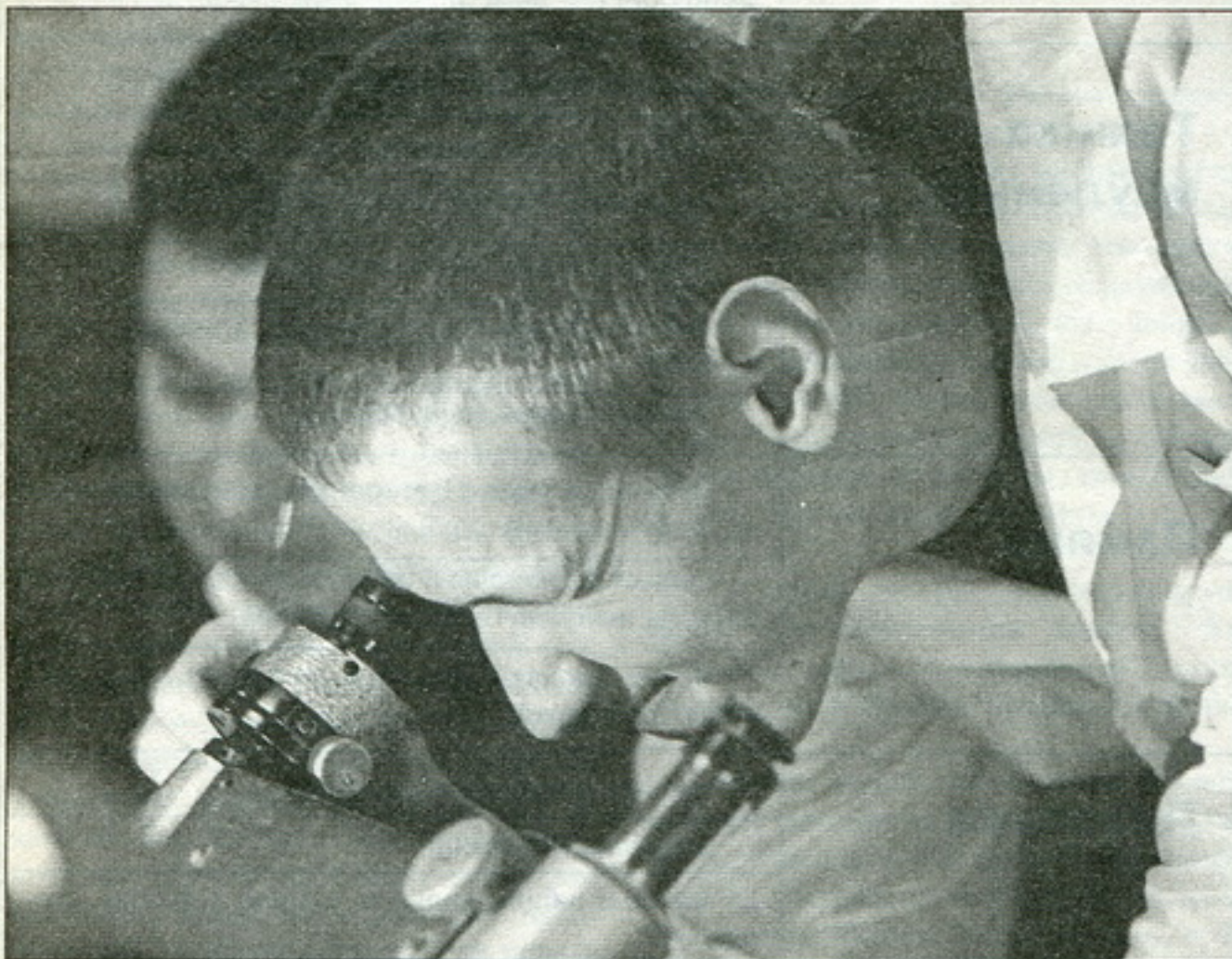
Студэнты хімічнага факультэту БДУ

шаць комплекс грамадзкіх задачаў, структурна злучаных у чатыры блёкі.