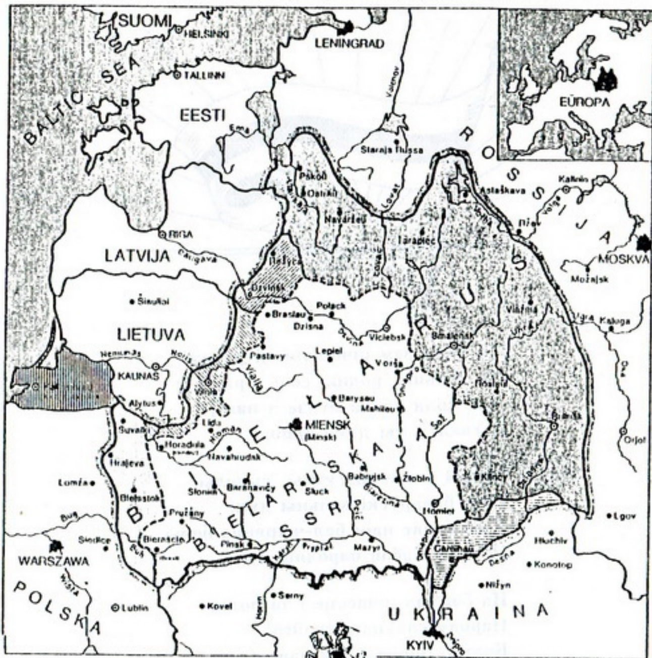
ETNAHRAFIČNAJA KARTA BIEĻARUSI