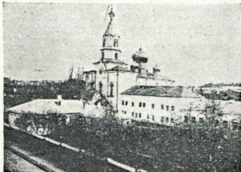
Катэдральны Петра-Паўлаўскі сабор, збудаваны у 1816 годзе.