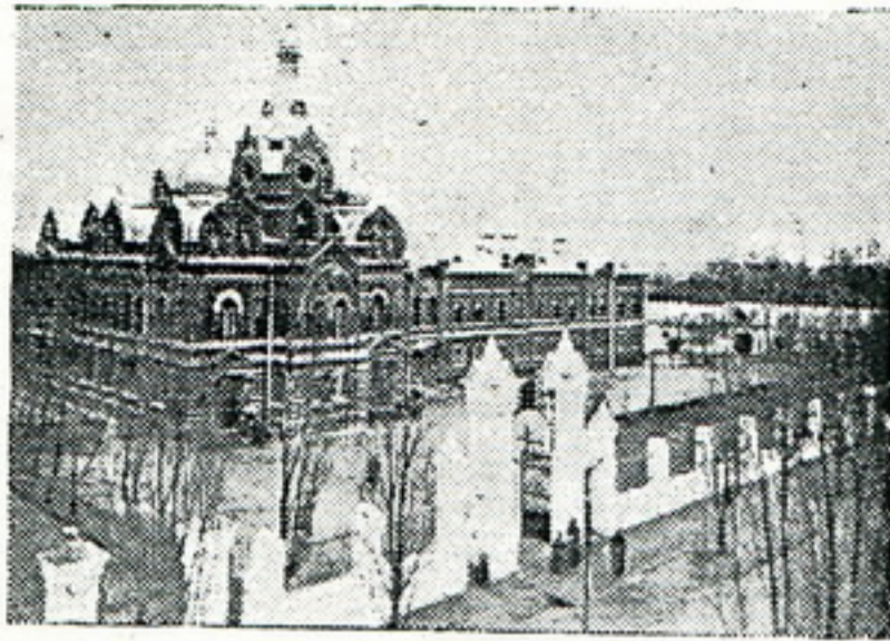
Крыжовая Пакроўская царква пры Архірэіскім доме.

Менск пачаў зноў паволі адбудоўвацца. У 1890 г. быў адчынены даволі буйны тэатр, які існуець і да сьняня, а у 1891 г. была пушчаная у рух менская «конка», прадмет шмат жартаў і анекдотаў, якая у 1928 г. была замененая трамваем. Электрычнае асьвятленьне датуецца з 1894 году. Прыватнымі асобамі было пабудавана шмат вялікіх будынкаў, што дало гораду заходня-эўрапейскі выгляд.