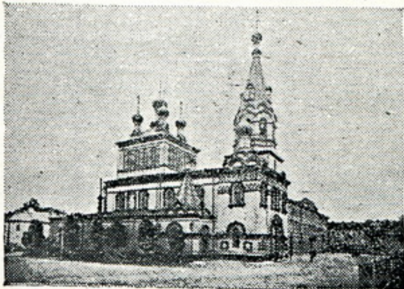
Жаночы Спаса-Прэабражэнскі манастыр.

У 1116 годзе Уладзімер Манамах заваяваў Менск, а Глеба узяў у палон, дзе ён і памёр. Пасьля Глеба у Менску да 1195 г. па чарзе княжылі: Расьціслаў, Валадар і Усяслаў. Пасьля перамогі літоўскага