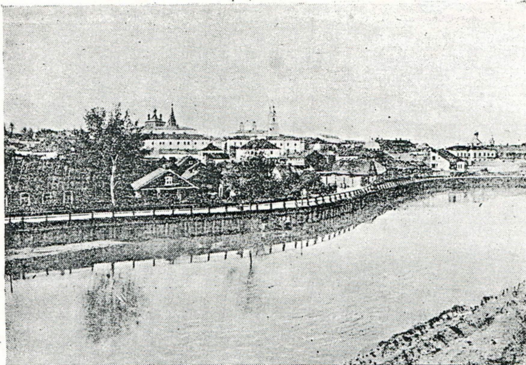
Месца, дзе знаходзіўся стары замак, акружаны Сьвіслаччу і Нямігай.

князя Рынгольда над саюзнымі князямі над берагамі Нёмна Менскае княства лучае у поўную заложнасьць ад Наваградзкага цэнтру. За дату канчальнага далучэньня Менску да Вялікага Княства Літоўскага ўважаюць 1326 г. Апошнім удзельным князем быў Фёдар Сьвятаславіч.