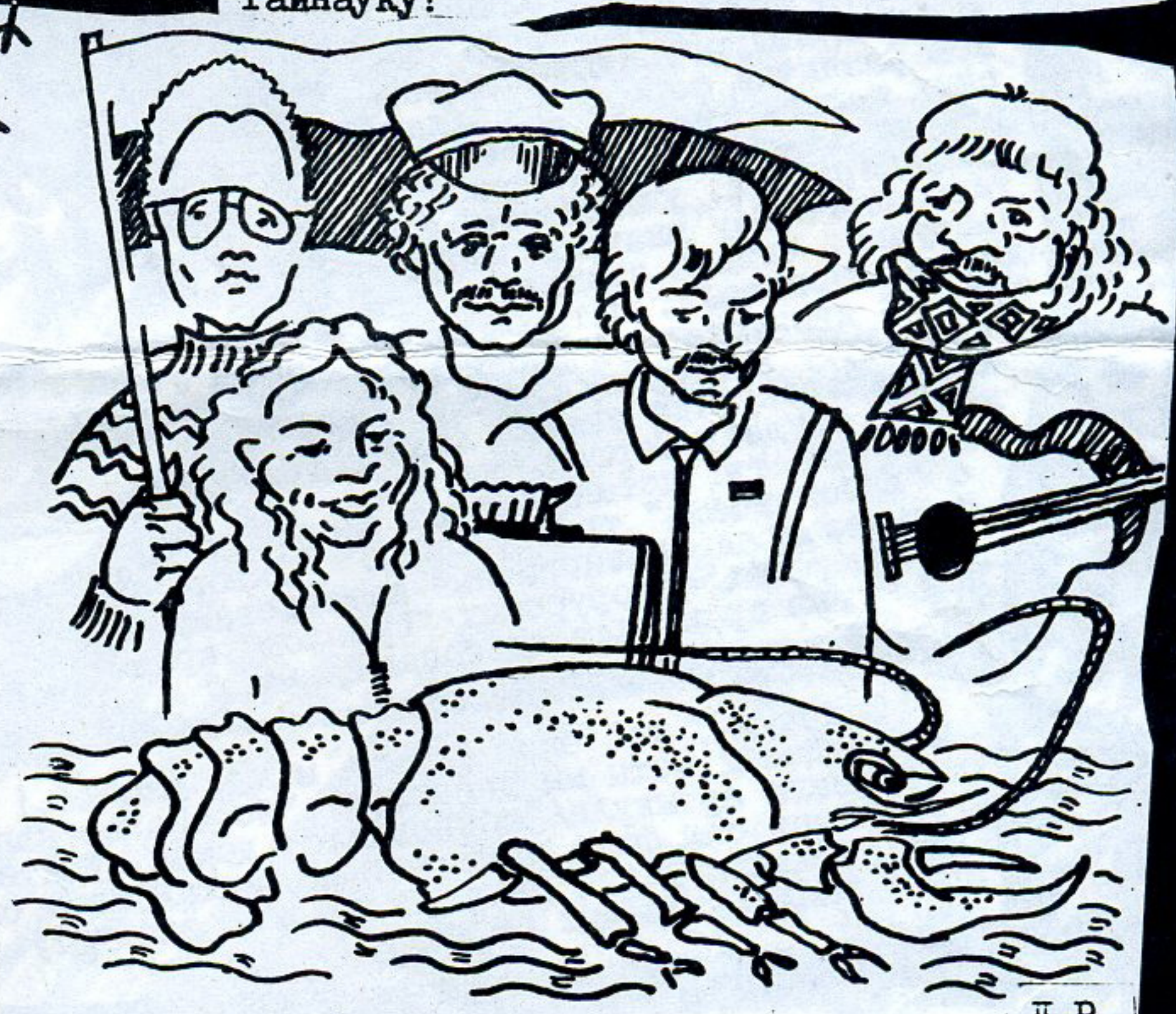
— Можа хоць гэты падвязе?.....