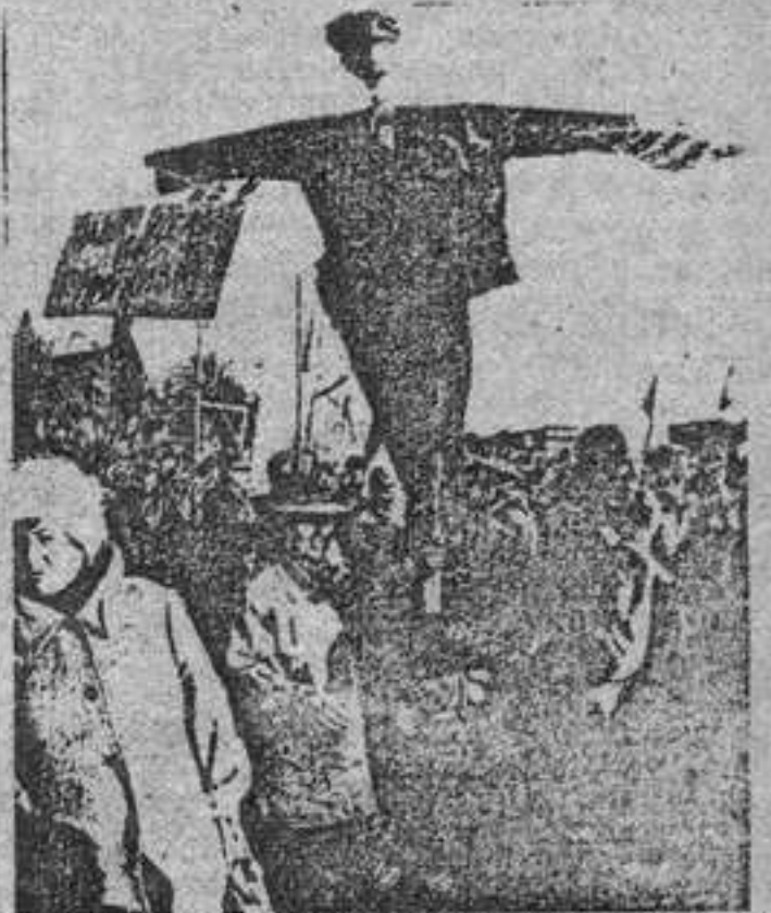
НА СНИМКАХ: с галочки лозунгами пришли 7 ноября на площадь имени Ленина в Минск участники альтернативного митинга. Маски, как говорится, сброшены.