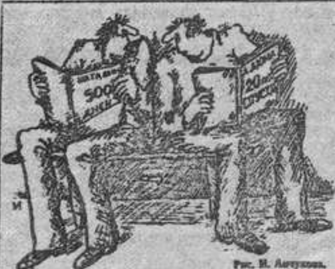
Рис. В. Антонова.

●... Зарегистрирован новый международный журнал для подростков "Вместе".