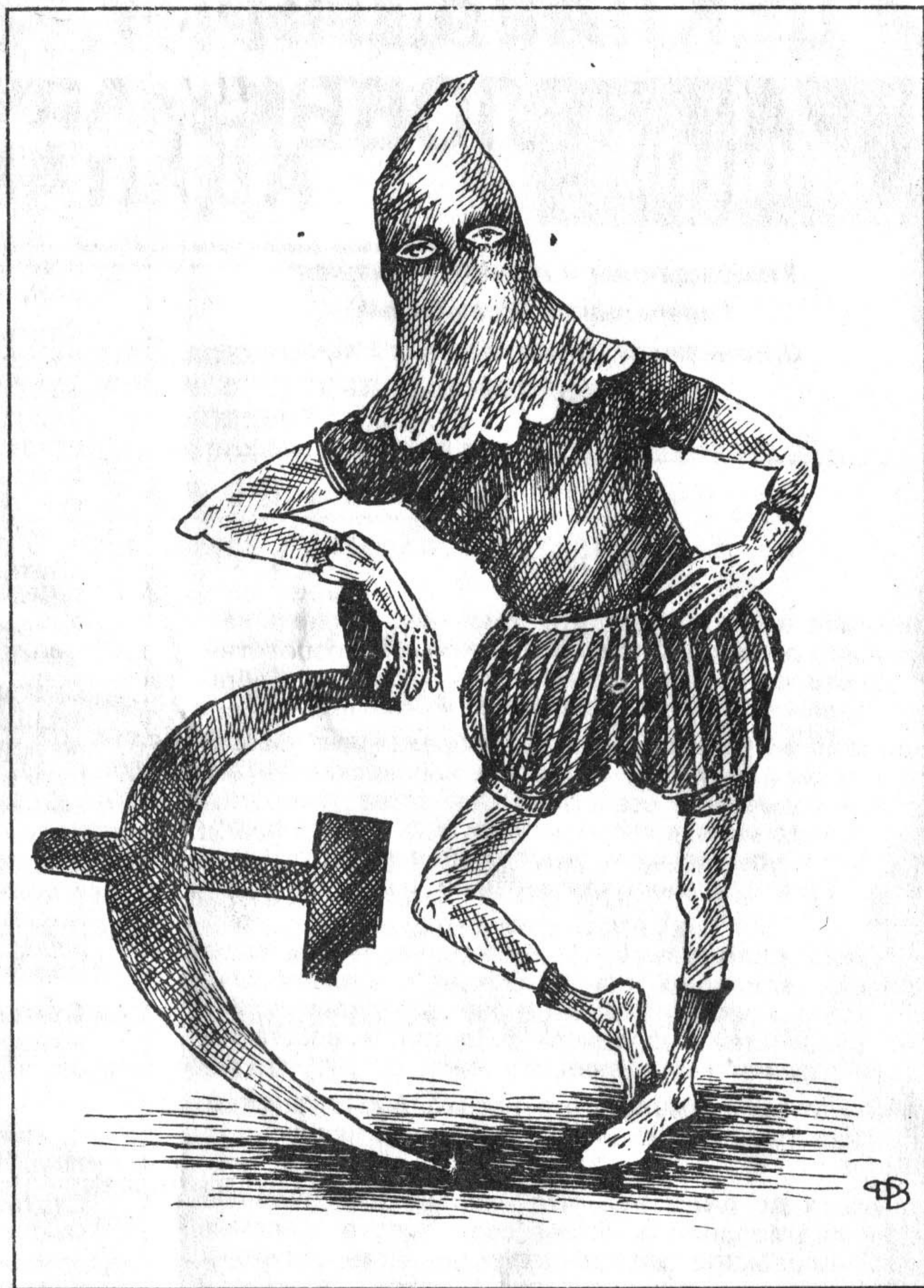
Рисунок Василия Дубова

Третье — проблема продовольствия . Нерешенность этой проблемы за минувшие пять лет перестройки не имеет оправданий. Мы считаем: без обеспечения реальной передачи