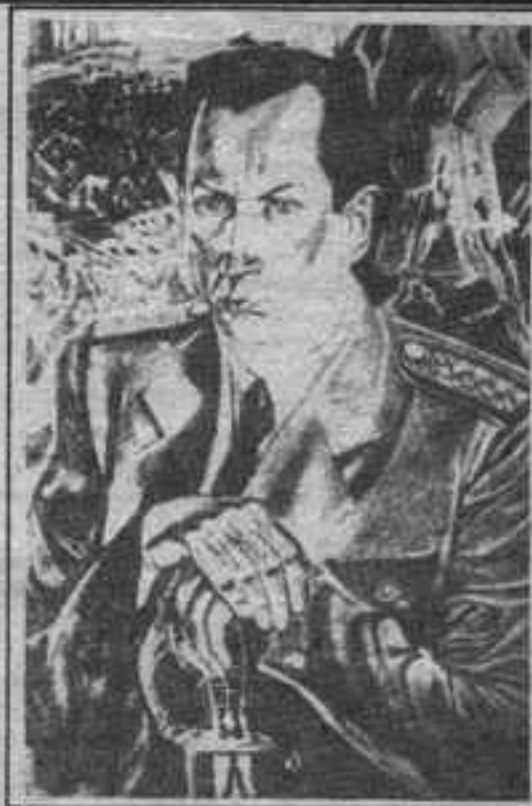
Максим Боровець (Тарас Бульба) Генерал-хорунжий, Отаман Поліської Січі 9.03.1908 — 15.05.1981

Зачепуючи цю тему, треба одмежуватися від невинної крові, яка лилася тоді на Поліссі, як з одного, так і з другого боку. Нам, сьогоднішнім, треба одмежуватися й од того насилля, яке було можливим тоді, та пістити до цієї теми з твердим розумінням, що проблеми решаються лише не збройною силою...