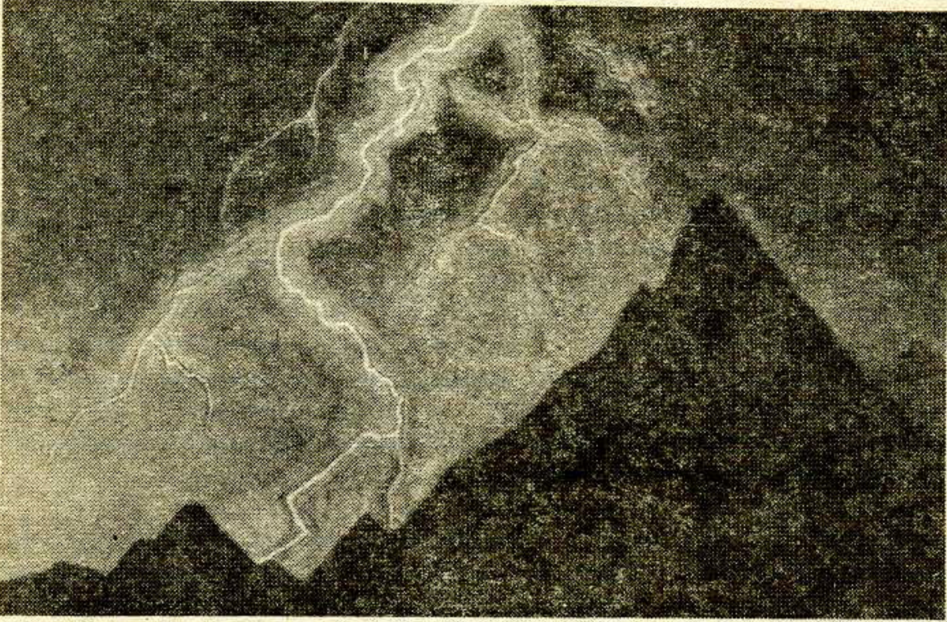
(Карціны М. К. Рэрыха).

Нельга патрабаваць нечага ад іншых, калі сам застаешся на нізкім узроўні духоўнага развіцця, парушаеш законы агульначалавечага братэрства, сееш вакол сябе раздражненне і злосць, думаеш толькі аб уласным здароўі, дабрабыце, лёгкім жыцці.