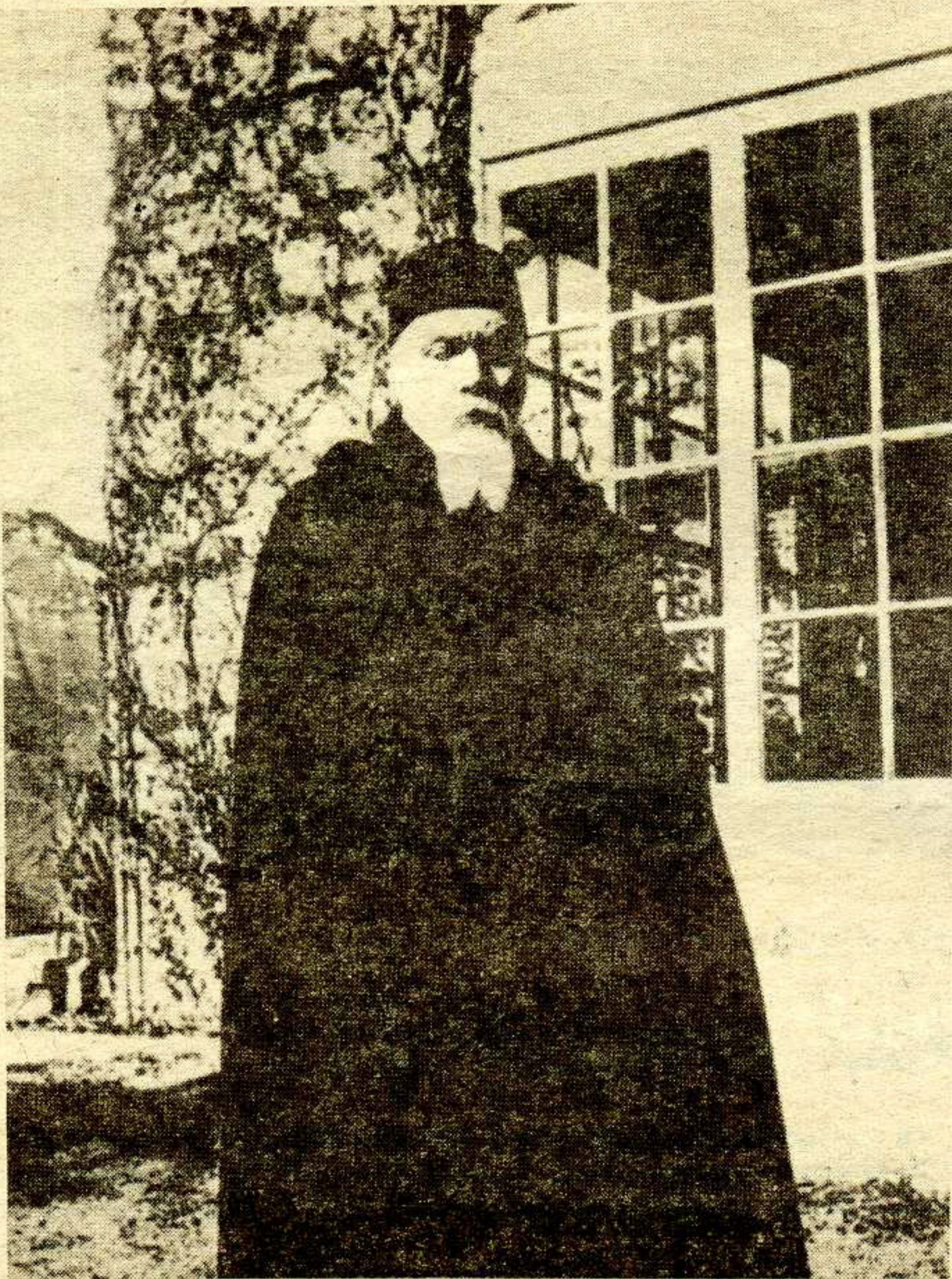
Мікалаі Канстанцінавіч Рэрых.

Мікалаі Канстанцінавіч РЭРЫХ быў асобай вельмі шырокага дыяпазону. Вялікі мастак, выдатны вучоны, унікальны філосаф, гісторык, этнограф, пісьменнік, паэт, грамадскі дзеяч... Гэта цэлы сусвет, спазнаваць які можна бясконца.