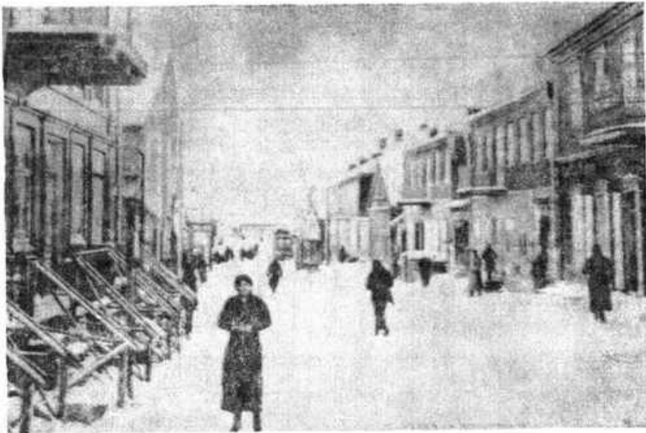
Цяпер тут вуліца У. І. Леніна. За першымі германца-

І так, з першым нумарам, да новай сустрэчы!