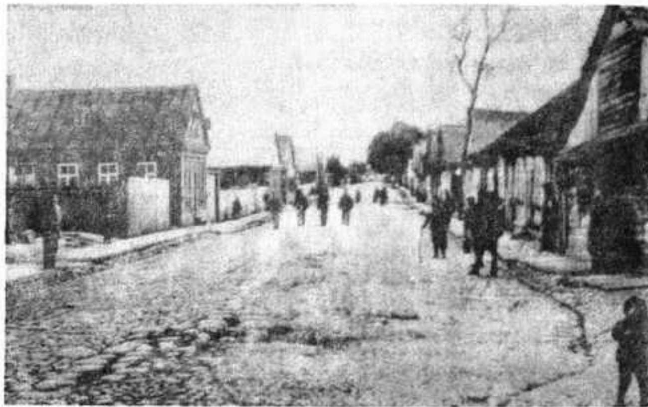
Цяпершняя вуліца Савецкая. А колісь яна насіла на-