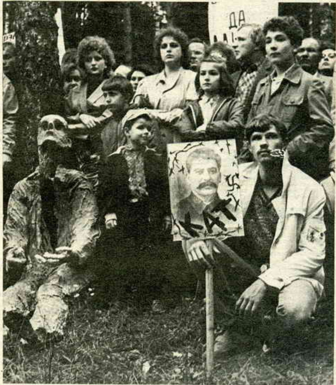
КУРАПАТЫ, 3 ЛІПЕНЯ 1988 Г.