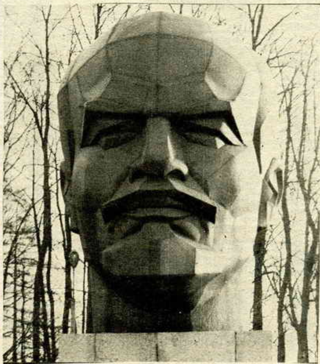
Воблік У. І. Леніна знайшоў свой выраз у шматлікіх аб'ектах манумэнтальнай прапаганды. НА ЗДЫМКУ: бюст У. І. Леніна.

Калі я з пачуцьцём вялікае палёгкі здаў свой партквіток і быў выключаны зь ленынскае партыі «за отход от позиций марксизма-ленинизма», адна ідэёвая на-мэнклятурная дама ўгаворвала мяне «не оставлять партию в трудный момент». Пры гэтым яна спасылалася на майго бацьку-нябожчыка, што, як ёй чамусьці здавалася, быў адданы ленынцам. Мяркую, што я лепей ведаю свайго бацьку і маці, якая таксама бязь сьлёз разьвіталася з «умом, честью и совестью эпохи». Падазраю, што ня толькі мяне бацькі ніколі не вучылі ва ўсім браць прыклад в Валодзі Ульянава. Ну і, вядома, не ў мяне аднаго аніколі, нават у хвіліны замарачэньня не ставала натхненьня на тое, каб стварыць апавяданьне, як Ленін любіў дзяцей, або скласьці вершык ці паэмку пра тое, як Ільліч, чытае «Правду» ці «думает пра Беларусь». І ўсё-такі кожны з нас волляй-нявольля дыхаў атрутнымі парамі акцыбрацка-піянерска-камсамольска-парцэйнай машыны. А таму яшчэ нядаўна дзядуля Ленін уяўляўся нам, безумоўна, ня геныем усіх часоў і народаў (пра інтэлектуальны ўзровень правадыра хораша скажаў адзін з высланых ім за мяжу «контрэвалюцыянераў» — М. Бярдзьеў), але, прынамсі, дзелячом, якога варта было чытаць і на якога ў дадзенай сітуацыі можна было спасылацца. Кажуць, яшчэ нейкіх пару гадоў таму кіраўнік Саюзу пісьменнікаў Латвіі Яніс Петэрс сарваў апладысмент, калі замест уласнае прамовы прачытаў на нейкай літаратурнай зборні