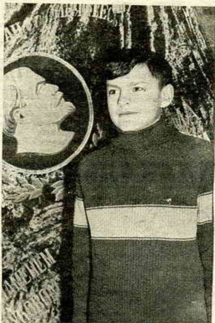
Аўтар, Ул.Арлоў у і4 гадоў

нальнікам тэрору, які закрэсьліў дзесяткі мільёнаў чалавечых жыцьцяў? Ленін ці Сталін?