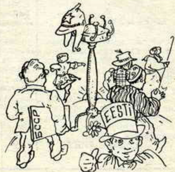
ШАПАЧНЫ РАЗБОР. Мал. С. Харэўскага